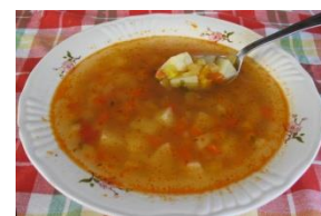
Kuřecí v __ v __ r