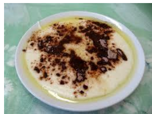
Krupicová __ __ š __