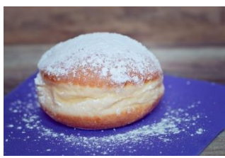
__ __ b __ __ ha