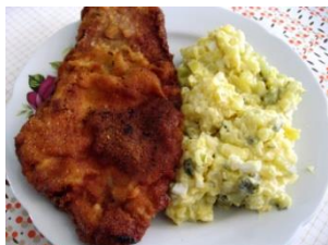
Smažený ř __ __ k, bramborový s __ __ á __