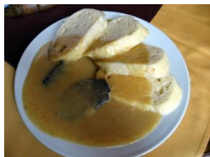
Svíčková omáčka, k n __ __ l í __ __