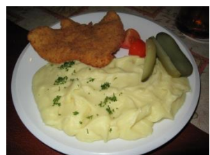
Smažený řízek, bramborová k __ __ e