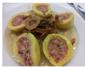
K __ __ d __ __ ky plněné uzeným masem